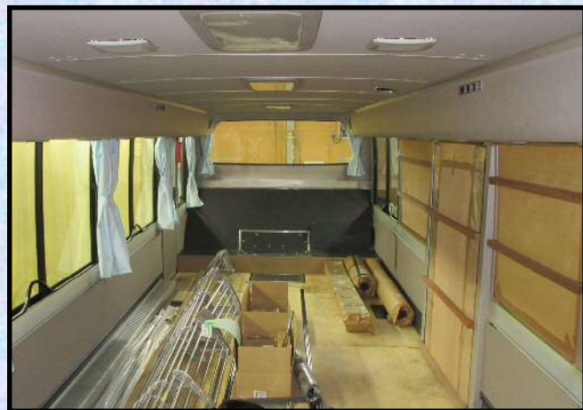
※バス製造ラインによるベース車両の完成車例（製造ライン受注仕様によって異なります。）