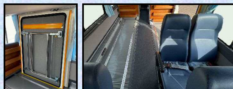
※リフト部サイドガードは特別仕様となります。